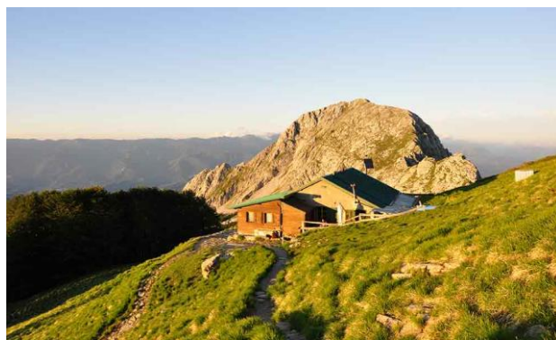
Rifugio Rossi alla Pania