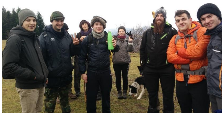
Alpe di Cavarzano – 26 dicembre 2017