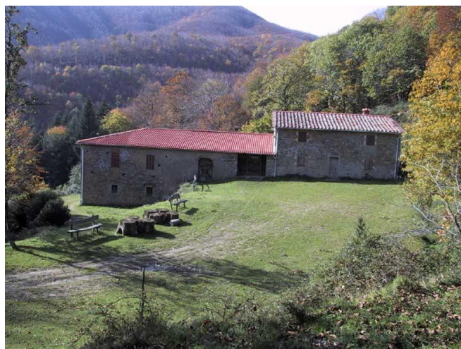
Il Rifugio Le Cave

Dislivello in salita totale m.800 circa Ore complessive di escursione circa 12