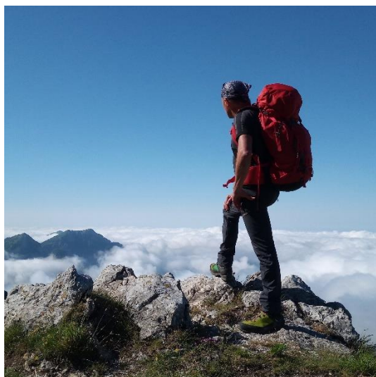
Salendo la Pania della Croce dal Rifugio Del Freo

Ven. 22.08 – Visita alla Grotta del Vento in una delle tre soluzioni (percorso base, percorso esteso, percorso avventura). Il costo è differenziato a seconda della soluzione e occorre prenotare. Percorso avventura: due soluzioni. Mattina € 50, pomeriggio € 70. Prenotazione entro fine luglio. Minimo due persone, massimo sei persone.