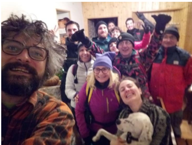
Un pomeriggio al Rifugio M. Cavallo